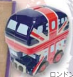
ロンドンバス型貯金箱 2,160円(税込)