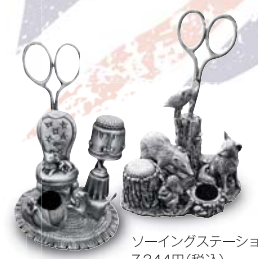
ソーイングステーション 7,344円(税込)

英国生活雑貨や伝統工芸品から英国流アイデア商品まで、いつもは“お目にかかれないグッズ”まで選りすぐったアイテムがいっぱい。