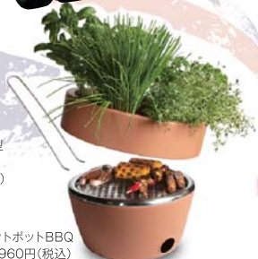
ホットポットBBQ 12,960円(税込)

英国王室御用達「パートリッジ」の紅茶や、ランドローバークッズなど、ここでしかお目にかかれない商品が多数並びます。