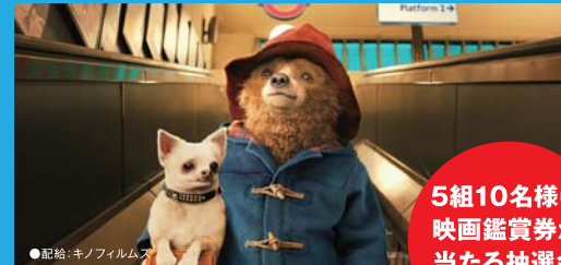
●配給:キノフィルムズ